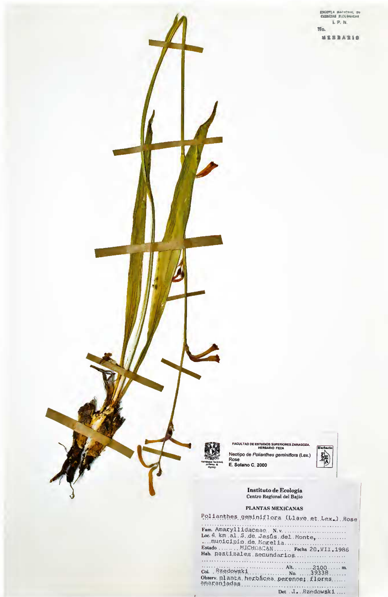
Fig. 2. Neotipo de Polianthes geminiflora (Lex.) Rose, J. Rzedowski 39338 (ENCB).